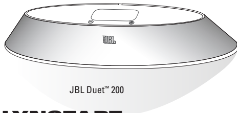
JBL Duet™ 200